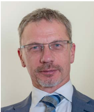
Boris Vujčić guverner

Očuvanje stabilnosti cijena i financijske stabilnosti trajne su i zakonom određene odgovornosti Hrvatske narodne banke te ujedno temelj njezina djelovanja i ključni strategijski ciljevi u ovom, kao i u svim budućim strategijskim razdobljima.